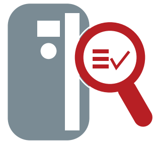
DrivePro® Site Assessment